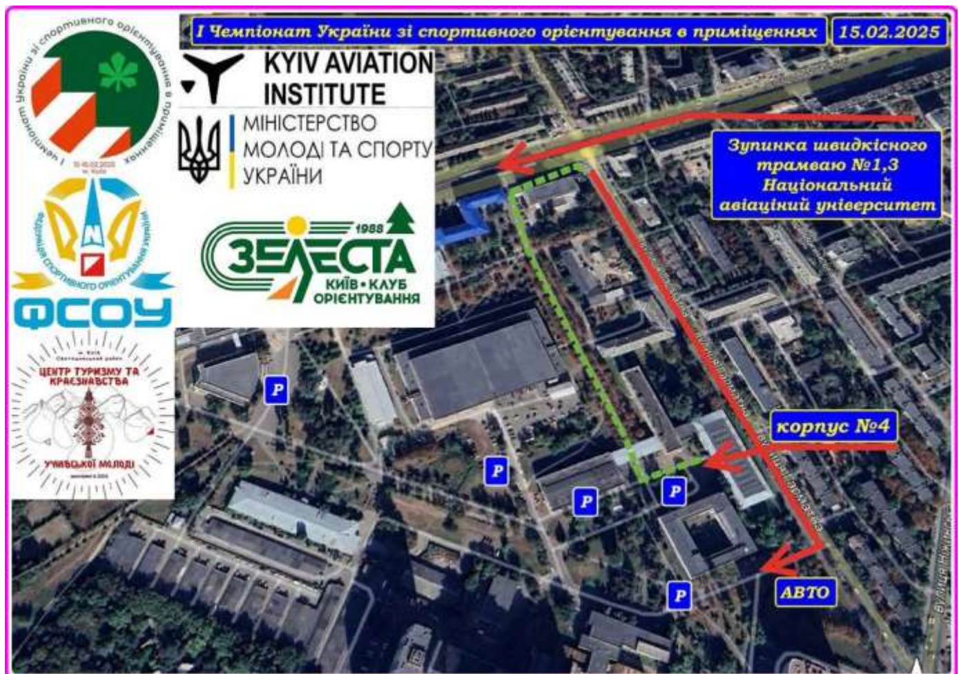
СХЕМА розташування арени змагань 15.02.2025

За рейтингом концертних залів міста Києва, ЦКМ ДУ «КАІ» займає третє місце після Палацу Україна та МЦКМ міста Києва (Міжнародний центр культури і мистецтв).