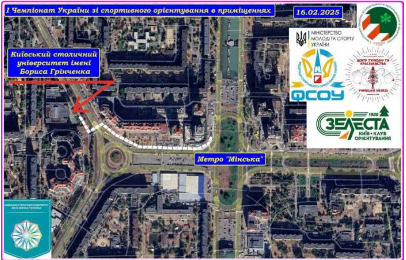
СХЕМА розташування арени змагань 16.02.2025